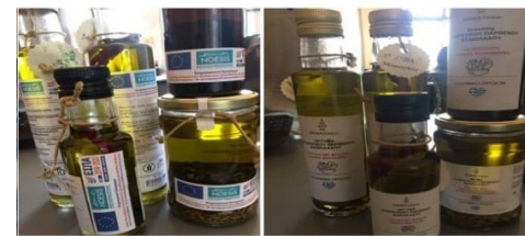
Μπουκάλι και βάζο με κατέκλι.